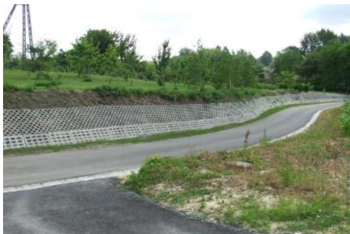
STAN PO SCALENIU