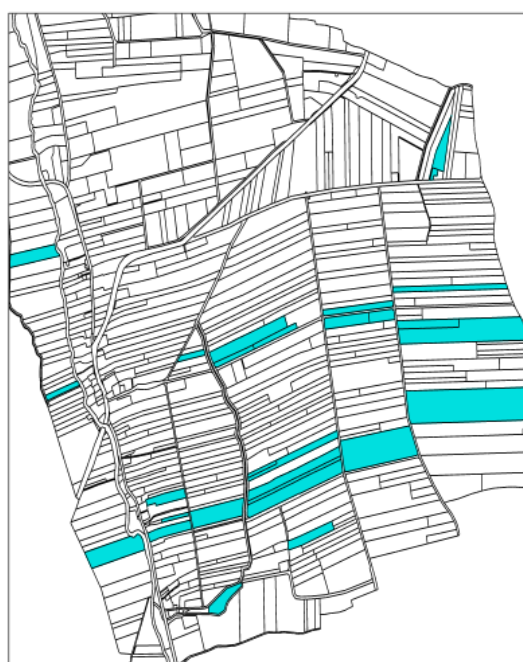
Po scaleniu 21 działek o łącznej powierzchni 31,27 ha