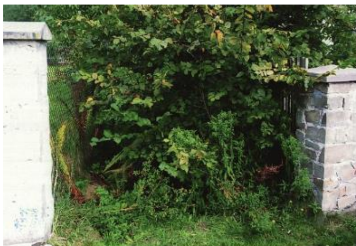
STAN PRZED SCALENIEM