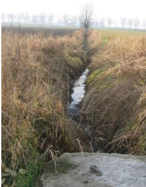
STAN PRZED SCALENIEM