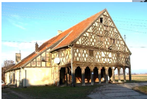
Gmina Stare Pole