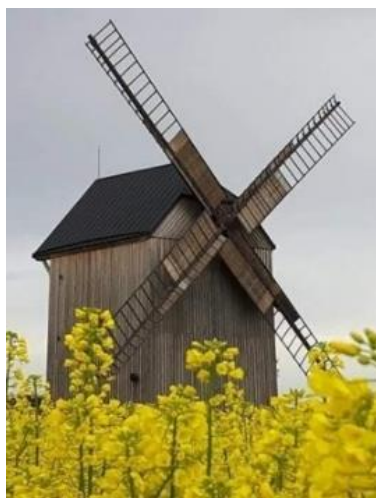
Gmina Pruszcz Gdański